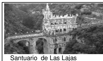
Santuario de Las Lajas